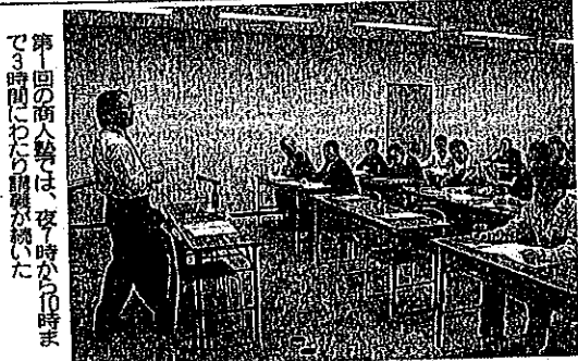
第1回の商人塾では、夜7時から10時まで3時間にわたり講義が繰り出された。

商店主らが参加し、個々の店舗の魅力を高めること、賑わいある商店街づくりを目指す北の商人あきんど塾が、15日(木)開講した。翌16日には、さっそく講師が受講者の店舗を訪れ、魅力アップへ具体的なアドバイスが行われた。